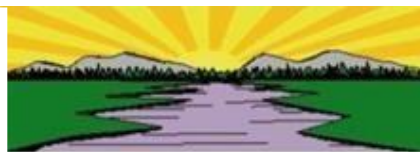
Coordination Régionale des Organisations du Sudes (CROSE)