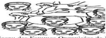
Réseau des Femmes Organisées de Jacn (REFOJ)