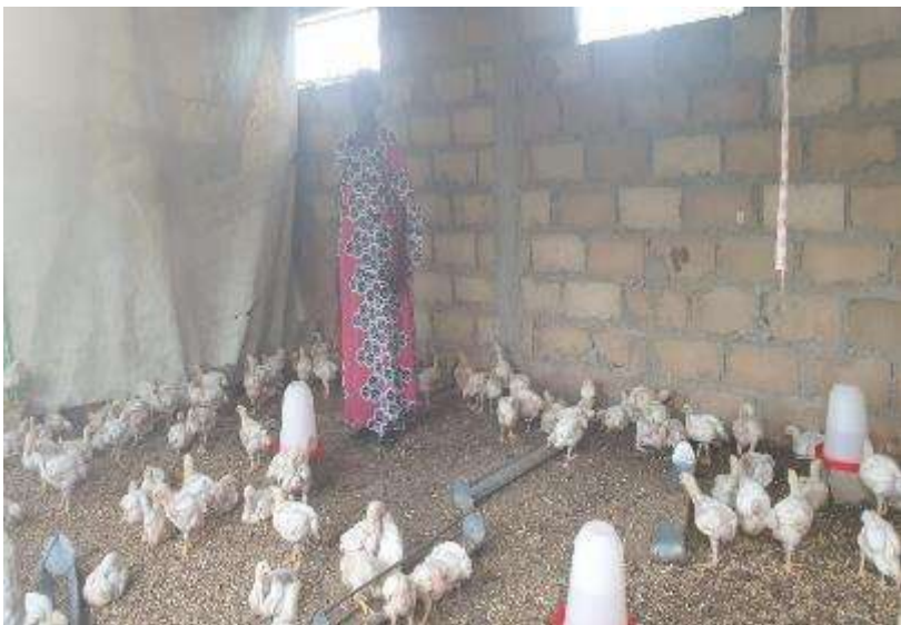
Ilustración 6. Granja de pollos e integrante de Comité de Gaty Yaram

“ Ahora estamos comiendo pollo más seguido y también huevos, porque tenemos la granja y esto nos facilita mucho (...) antes no podíamos comprar pollo, solo en ocasiones especiales y celebraciones porque no tenemos los recursos económicos suficientes para hacerlo(...) con la granja podemos tener la oportunidad de trabajar en la granja y tener pollo para nuestras familias”.