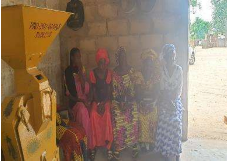
Ilustración 5. Plataforma de transformación de cereales y mujeres de comité de gestión

En la visita a las comunidades se pudo observar estas plataformas de transformación de cereales en funcionamiento, y el uso y mantenimiento que las mujeres están dando a las máquinas, y la gestión de los ingresos que obtienen, que se están destinando a otras actividades económicas como la crianza de ganado y la comercialización de diversos productos. Por otra parte, las mujeres expresan preocupación porque constantemente se han malogrado las máquinas porque están utilizando un motor de gasóleo, lo que les demanda inversión de dinero para arreglarlo, y deja pérdidas económicas; a lo que se suma la disminución de la