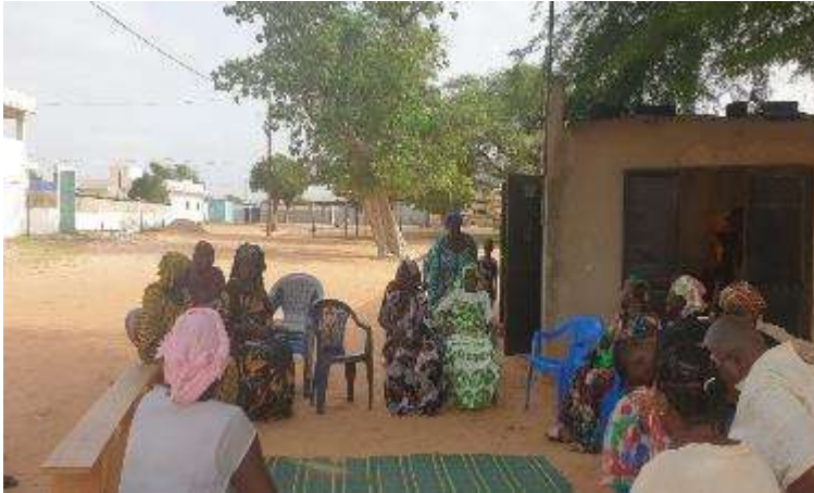
Ilustración 4. Mujeres de Comité de transformación de cereales

organizándose, y poco a poco van ganando reconocimiento social en sus comunidades porque han liderado las fases productivas y asumen la responsabilidad en la gestión y administración de los emprendimientos productivos.