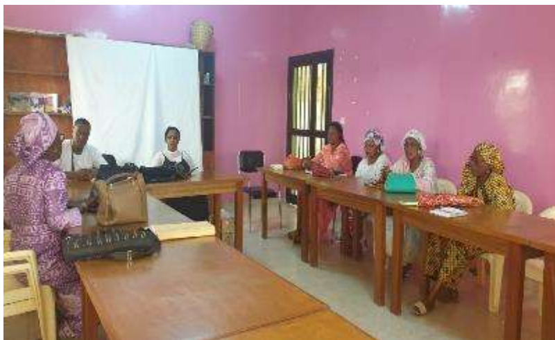
Ilustración 8. Red de mujeres activistas de Kebemer

El proyecto ha creado y fortalecido 12 estructuras organizativas locales que son los 6 comités de gestión para las plataformas de cereales y los 6 comités de gestión de las granjas de pollos, quienes se beneficiaron de un programa de desarrollo de capacidades en materia de gestión técnica, gestión financiera y administrativa, dinámica organizativa, etc. Estas estructuras comunitarias son las responsables de la gobernanza de las iniciativas productivas creadas con el proyecto y han sido fortalecidas para su