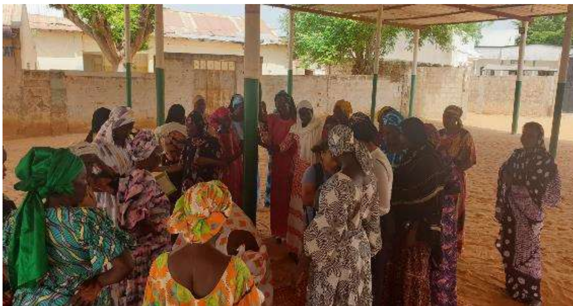
Ilustración 9. Mujeres participantes en grupo focal con comités de gestión

La intervención integró de forma efectiva el enfoque de derechos humanos, en la medida que las acciones planteadas han permitido fortalecer las capacidades de los titulares de derechos (mujeres, población, y liderazgo femenino), dejando bases para que en una siguiente fase puedan involucrarse en procesos de exigibilidad y demanda de sus derechos ante los titulares de obligaciones.