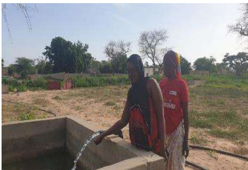
Ilustración 7. Mujeres de Ndiakher con fuente de agua abierta

A pesar de los cambios y limitaciones que se presentaron, finalmente, se logró construir los 15 sistemas de abastecimiento de agua para el consumo doméstico y las actividades agro-pastorales, alcanzando un 100% de logro.