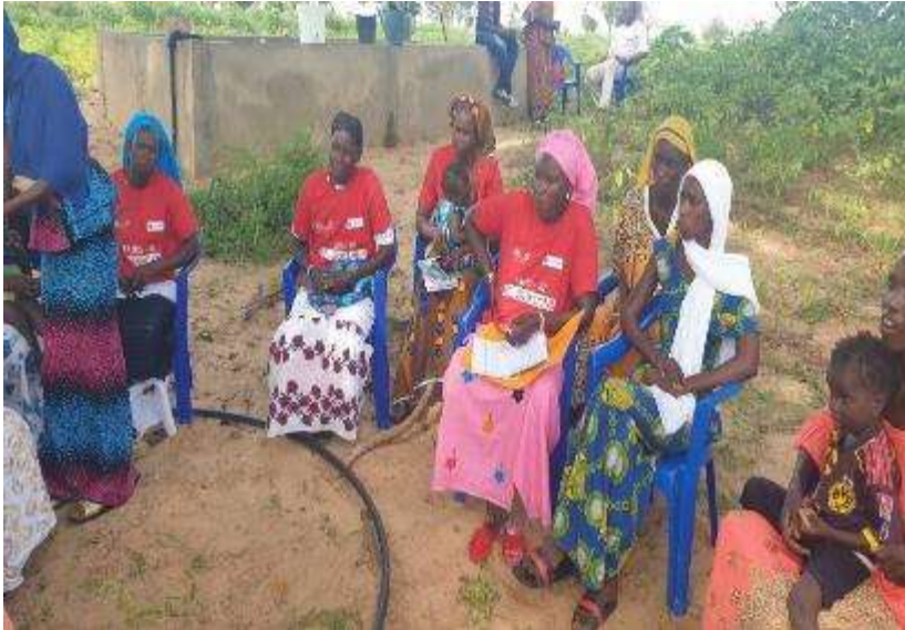
Ilustración 1. Grupo focal con mujeres de Comité de producción hortícola

locales y departamentales, la ASOFUR, y la población en las comunidades donde se hicieron las visitas y demás actores, lo que legitima el ejercicio evaluativo. En general, en todos los espacios convocados hubo una alta participación de personas que estuvieron directamente involucradas en las acciones del proyecto y personas de la comunidad.