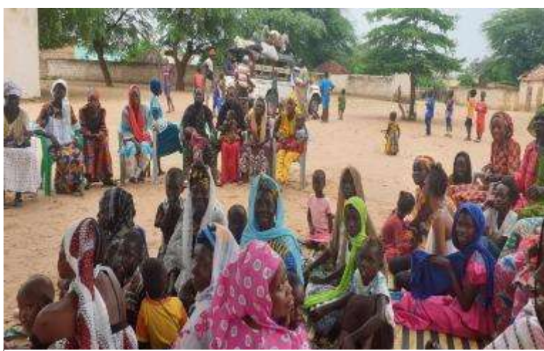
Ilustración 3. Grupo focal con mujeres de plataforma de transformación de cereales

No se han presentado limitaciones sustanciales que hayan podido afectar el desarrollo de la evaluación y sus resultados. Se destaca la disposición de FADEC y NE-SI para en el levantamiento de información en terreno, que facilitó la logística necesaria para el desplazamiento a las comunidades meta e hizo una efectiva convocatoria.